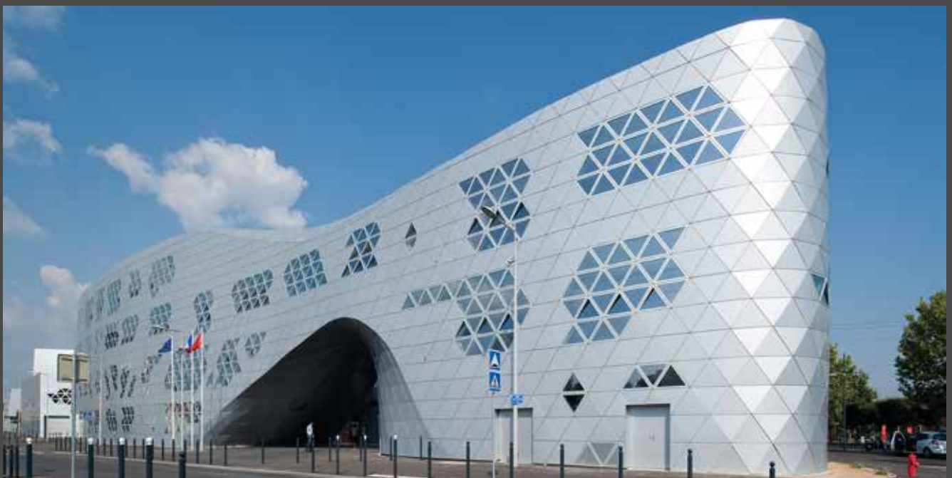
Lycée Georges Frêche, France | Architect: Massimiliano and Doriana Fuksas, Rome, Paris | Fabricator: Tim Composites, SMAC Toulouse Material: ALUCOBOND® anodized look C0/EV1

Die Verwendung hochwertiger Fluorpolymer-Lacksysteme, die in einem kontinuierlichen Lackierverfahren (coil coating) appliziert werden, garantiert die kompromisslose Verwirklichung des ursprünglichen Designs.