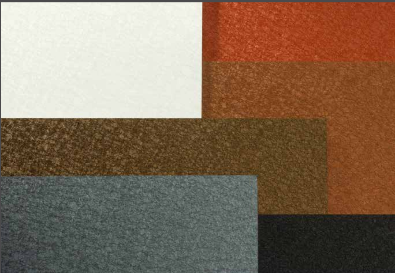
Characteristic of ALUCOBOND® terra is the crystalline matt sheen of the surface which changes with the light. | Charakteristisch für ALUCOBOND® terra ist die kristalline Oberfläche, deren Farbigkeit mit dem Lichteinfall matt changiert.

Beständigkeit, Ursprünglichkeit und Wertigkeit, dafür stehen Steine und Kristalle. Sie zaubern lebendige Lichtreflexe und überraschen mit unterschiedlicher Haptik von rau bis glatt. ALUCOBOND® terra ist inspiriert vom Schillern der Gesteine. Die Oberflächen der Dekore brechen das Tageslicht mit mattem Schimmer und zaubern so mal eine elegante, mal eine erdig changierende Farbigkeit. ALUCOBOND® terra verbindet die für Steinplatten typische, kristalline Oberfläche und samtige Haptik mit vielen Vorteilen der ALUCOBOND®-Verbundplatten: Anders als die meisten Natursteinplatten sind ALUCOBOND®-Verbundplatten sehr dünn und leicht, haben aber gleichzeitig eine hohe Biegesteifigkeit sowie Bruchfestigkeit. Große Plattenformate lassen sich einfach und passgenau herstellen, bearbeiten, transportieren, montieren sowie durch Abkanten und Rundbiegen mehrdimensional verformen. Dazu weist ALUCOBOND® terra, im Gegensatz zu vielen Steinoberflächen, eine sehr hohe Witterungs- und Farbbeständigkeit auf.