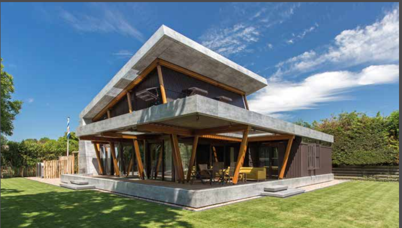
Holiday Home, the Netherlands | Material: ALUCOBOND® PLUS vintage Rough Concrete | Architect: Architekenburo TEN HOVE B.V. | Fabricator: MZAllpro | Installer: Cladding Partners B.V.